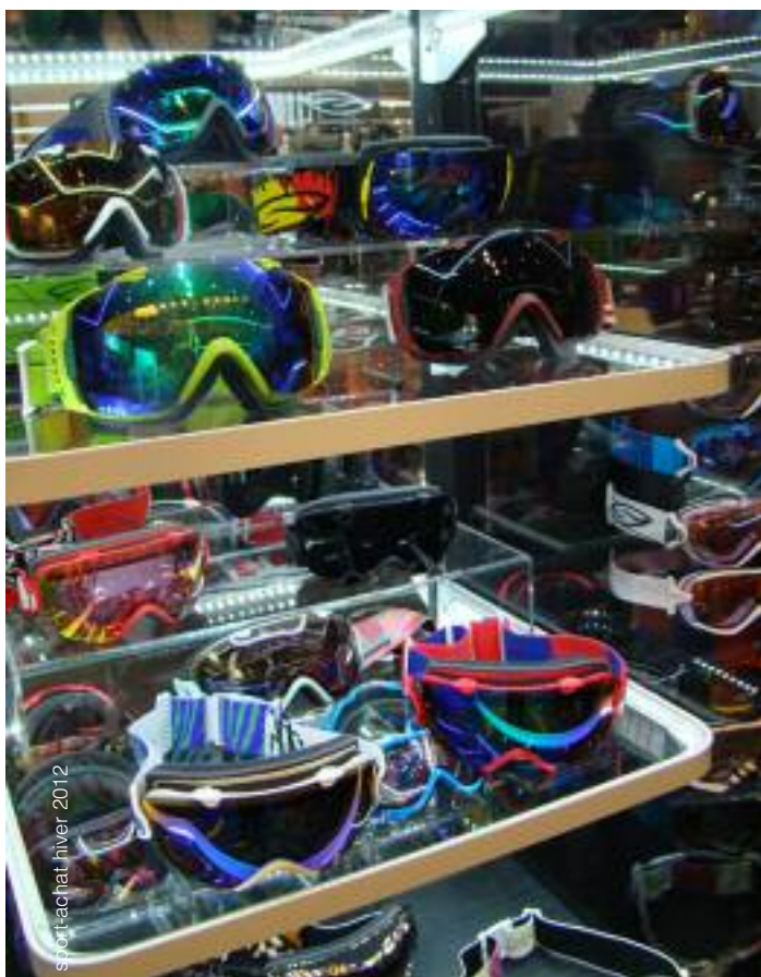
sport achat hiver 2012

Le stick à lèvres est l'accessoire incontournable pour éviter d'avoir les lèvres gercées . En termes de protection solaire, il est soumis aux mêmes catégories que les crèmes solaires.