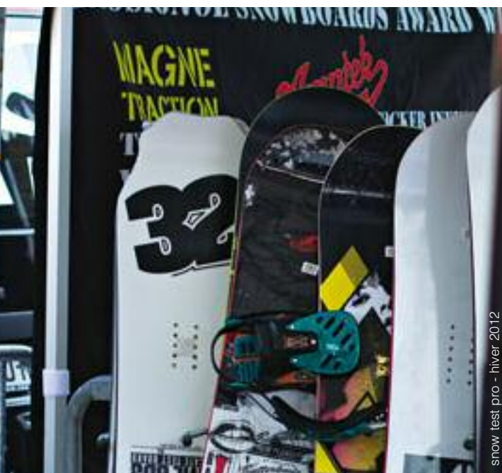
snow test pro - hiver 2012

Ski nordique, Snowboard, Snowscoot, raquette à neige, luge... en élargissant leur offre d'équipement, les professionnels des sports d'hiver accompagnent la diversification des activités sportives et de loisirs en montagne pour le plus grand plaisir de toute la famille. Des forfaits multi-glisse permettent ainsi de varier les plaisirs durant son séjour dans un budget défini.