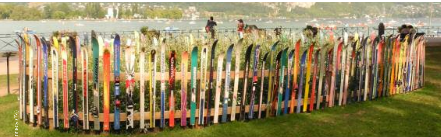
ville d'annecy (74)

A la fin de chaque saison, les professionnels des sports d'hiver renouvellent environ 30% de leur parc de location pour maintenir le niveau de qualité du matériel proposé aux clients. Ils font preuve d'ingéniosité pour que ce matériel usagé soit valorisé le mieux possible et idéalement recyclé.